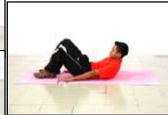
Gambar D Ringkuk Tubi Separa