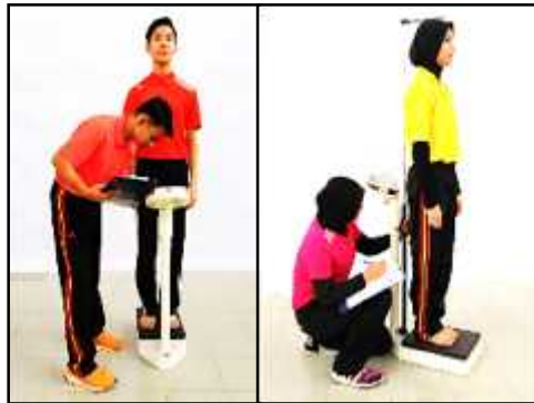
Gambar A Indeks Jisim Badan