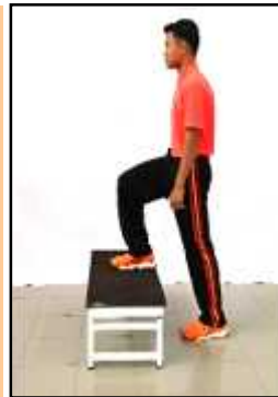
Gambar B Naik Turun Bangku 3 Minit