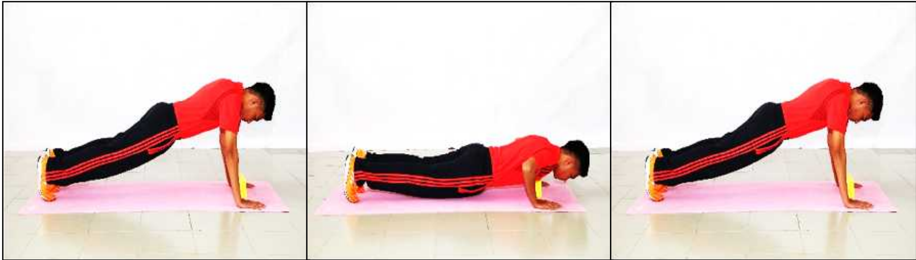
Gambar A - Sokong Hadapan atau Bersedia