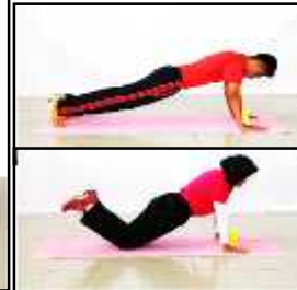
Gambar C Tekan Tubi atau Tekan Tubi Ubah Suai