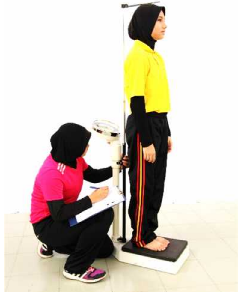
Ilustrasi 3: Mengukur Tinggi