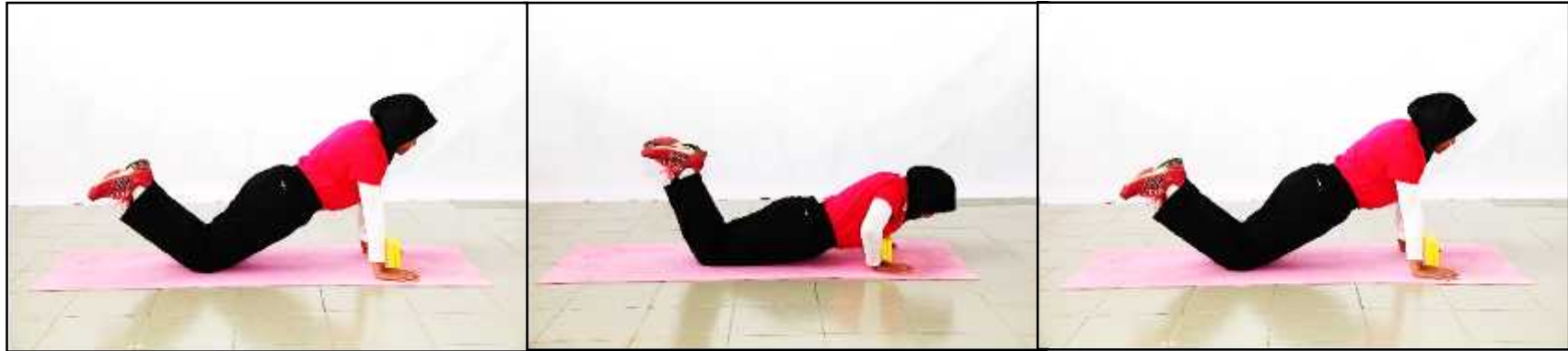
Gambar A - Sokong Hadapan atau Bersedia