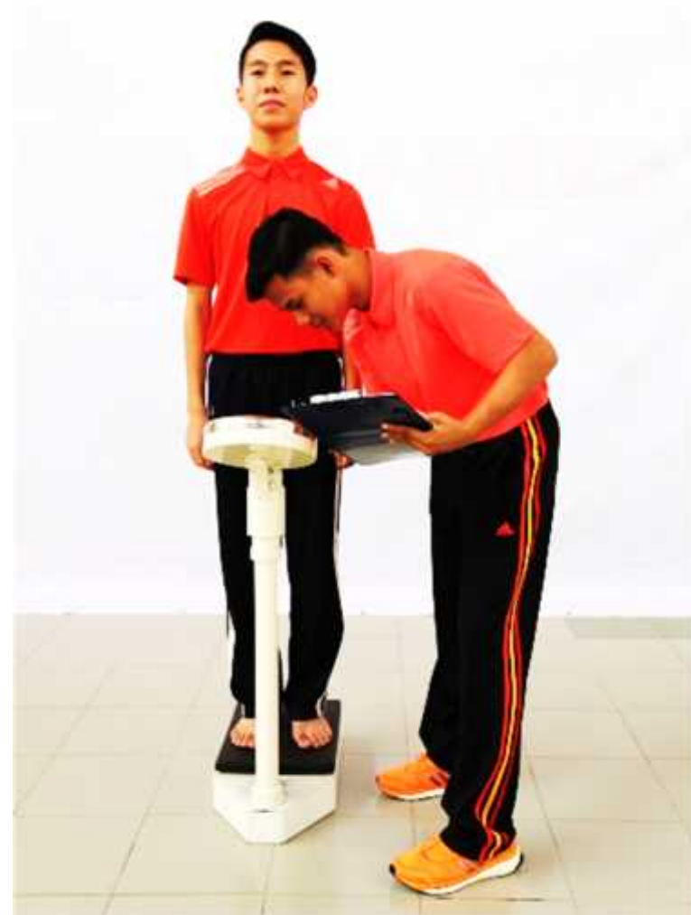
Ilustrasi 2: Mengukur Berat Badan