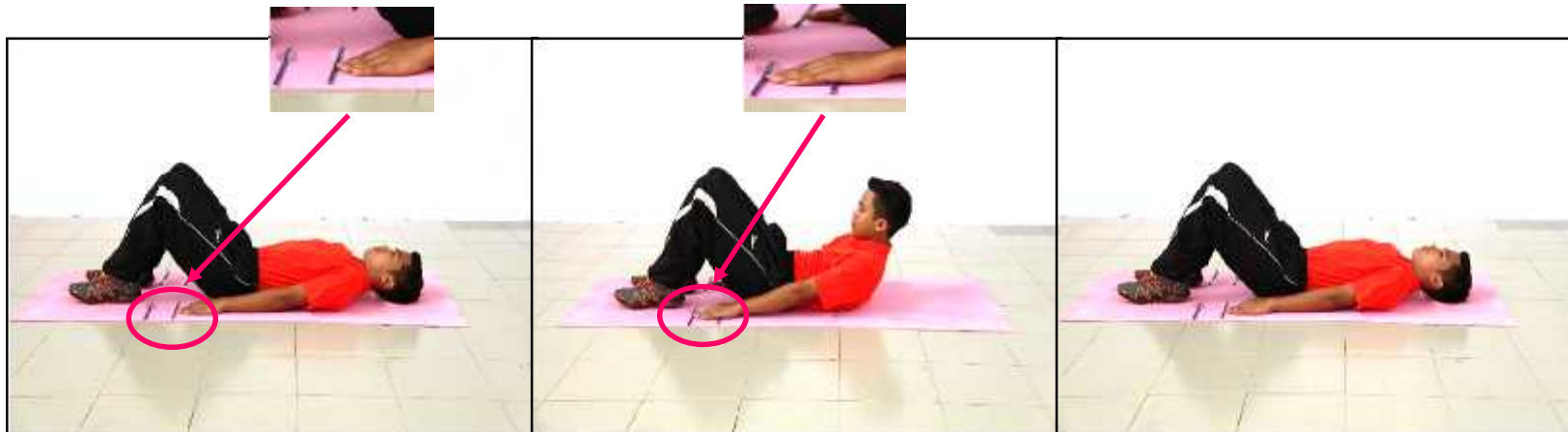
Gambar A - Sedia