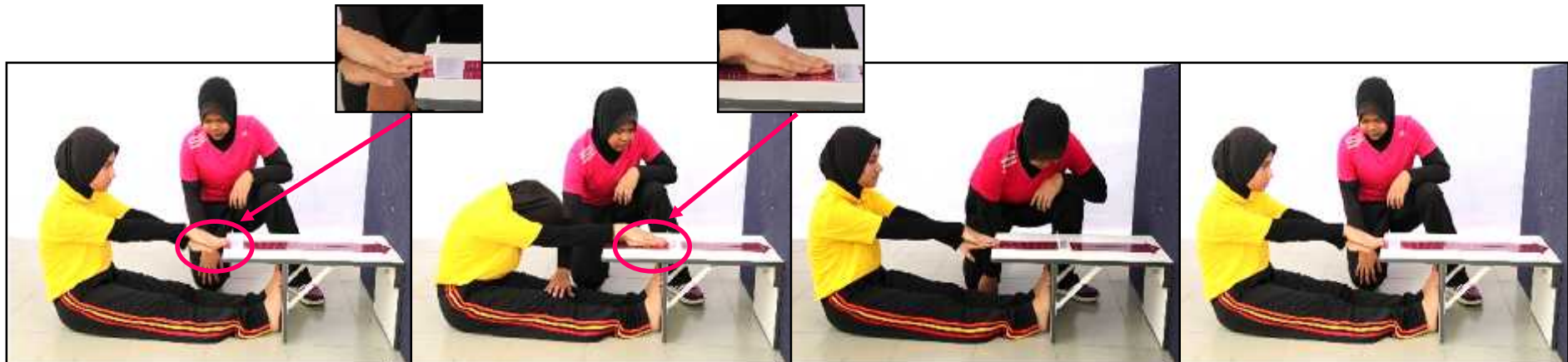
Gambar A - Sedia